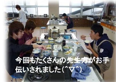
今回もたくさんの先生方がお手伝いされました(´▽`)