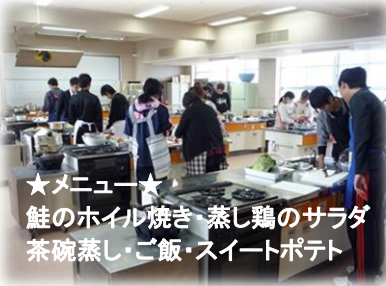
★メニュー★ 鮭のホイル焼き・蒸し鶏のサラダ 茶碗蒸し・ご飯・スイートポテト

調理実習の様子です。生徒たちはおいしく調理できるように頑張つて実習を行いました。今回は男子生徒の参加がとても多かったです。この実習で、ぜひとも今後の生活に役立ててもらいたいです。