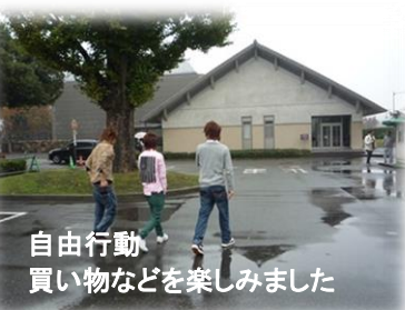
自由行動 買い物などを楽しみました