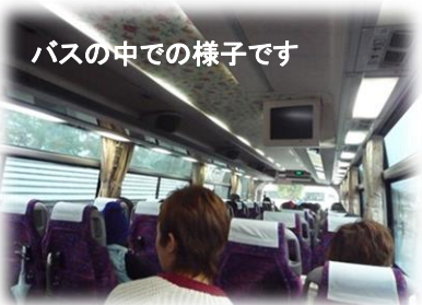
バスの中での様子です

1日遠足の様子です。～in小倉 とても楽しい遠足になりました。バスの中では先生方や友達同士で話をしたりして賑やかでした！