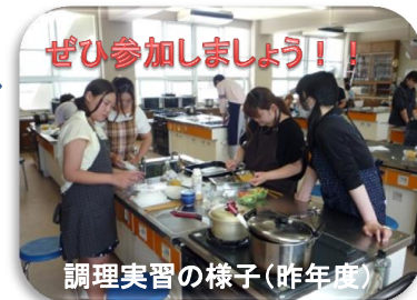
調理実習の様子(昨年度)