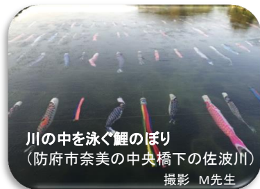
川の中を泳ぐ鯉のぼり (防府市奈美の中央橋下の佐波川)

男児の健康と成長を祝って5月5日に屋外に鯉のぼり(鯉は滝を上って龍になるという伝説から立身出世を表す)を立て、部屋に武者人形を飾り、菖蒲湯に入ったり、柏餅やちまきを食べます。今日では「子どもの日」として、すべての子どもが幸福に、健やかに成長するように国民の祝日になっています。