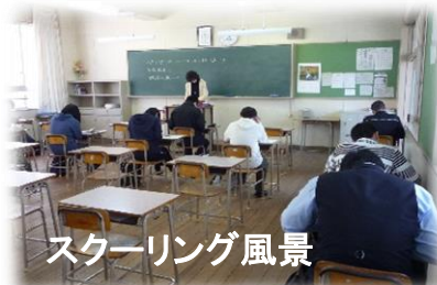
スクーリング風景

人生とは自転車のようなものだ、倒れないようにするには走らなければならない。 (アインシュタイン ドイツ 理論物理学者 ノーベル物理学賞受賞)